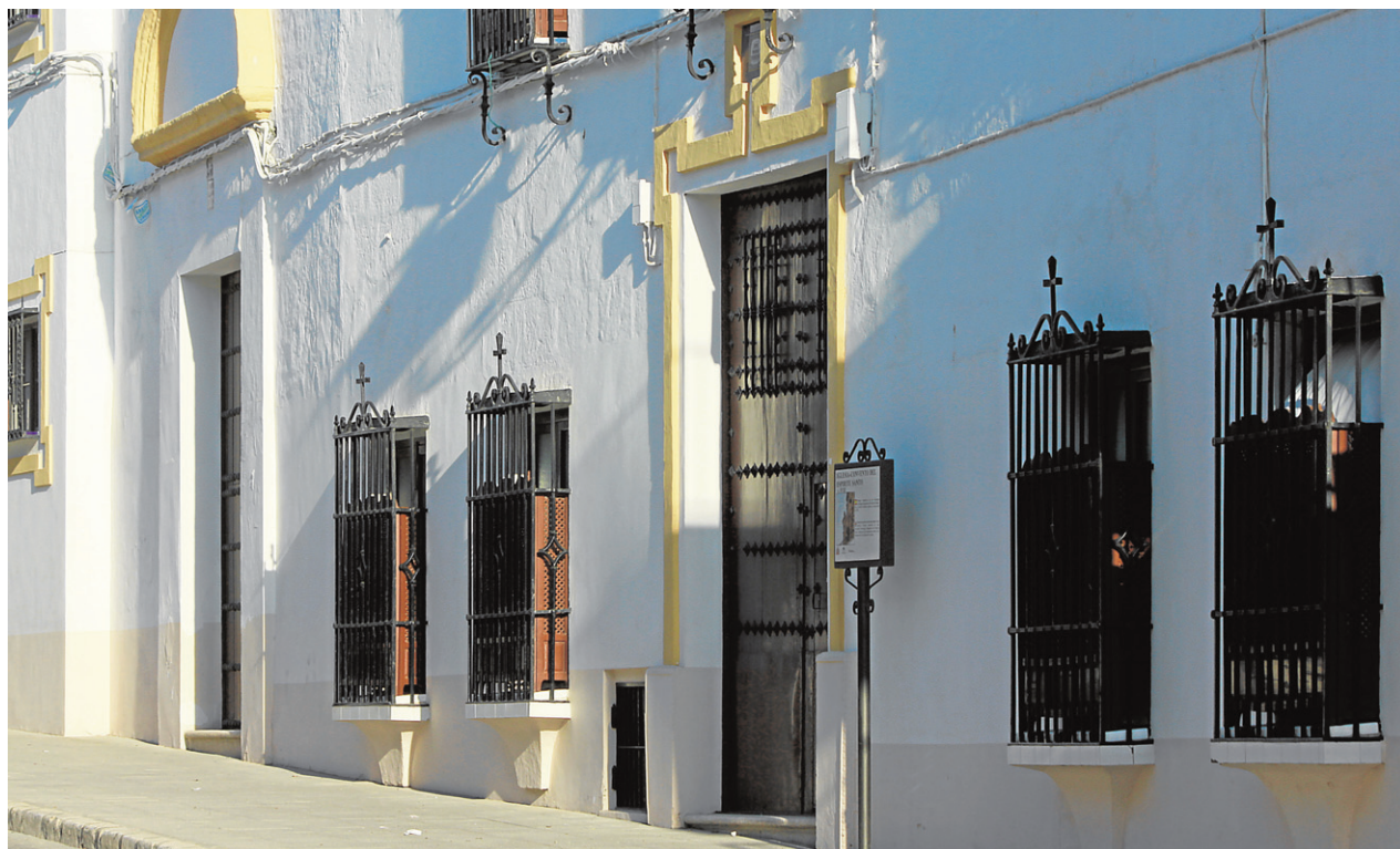
Fachada del convento donde viven y trabajan las Hermanas de la Cruz de Osuna

que cada día, a las seis de la mañana, comienzan su jornada para asistir en casas particulares de la localidad, a unas seis mujeres que, indispuestas y sin recursos, necesitan de su ayuda. Asimismo, el trabajo continúa a la vuelta al convento, atendiendo a los más necesitados, así como a las nueve ancianas de la residencia con la que las Hermanas cuentan en la localidad y, todo ello, unido a una vida de entrega espiritual y de oración que, a grandes rasgos, podríamos resumir en la misa diaria, así como la vida en común de la que participan, entre otras actividades, que, desde el propio convento, se ponen en marcha a lo largo del año, como puede ser el solemne triduo en honor a Santa Ángela que tiene lugar en noviembre, la cual fue canonizada en 2003 por el Papa Juan Pablo II, al igual que Madre María de la Purísima, que lo será el próximo 18 de octubre.