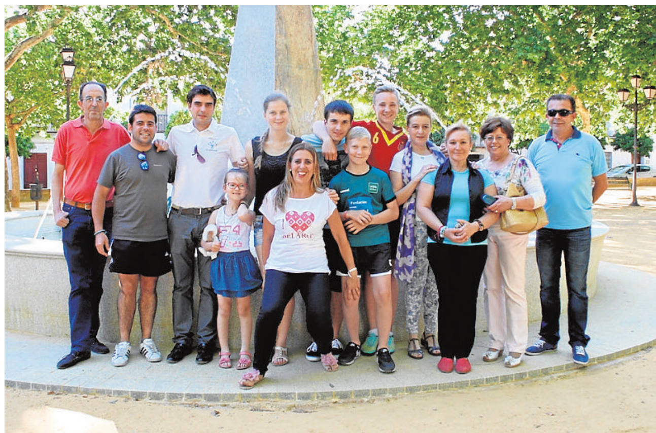
Los niños bielorrusos junto a sus familias de Guadalcanal