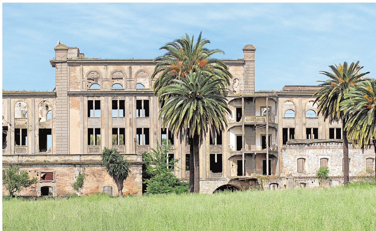
Estado actual de la Fábrica de Harinas, Electricidad y Tejidos de Peñaflor