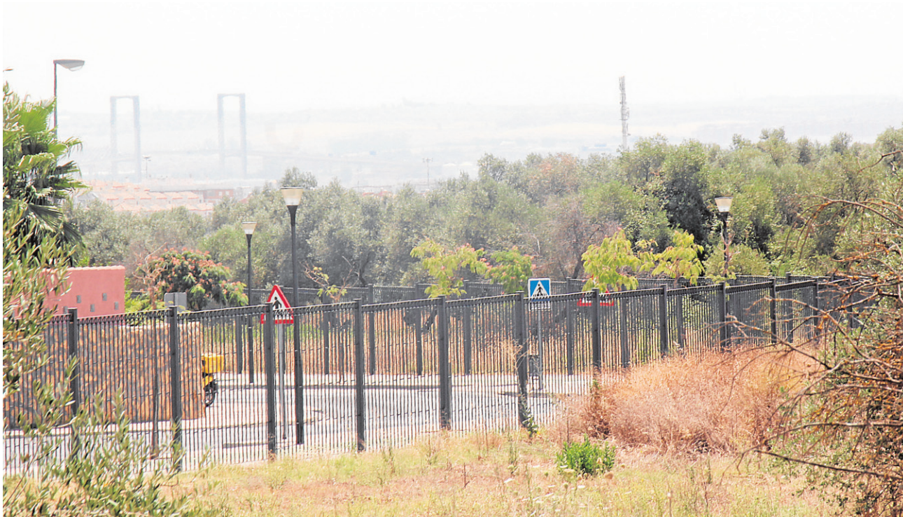
Terrenos del futuro parque del Olivar del Zaudín, en Tomares

Rosario de Benacazón, en colaboración con el Ayuntamiento. En esta edición, el evento tendrá lugar los días 3, 4 y 5 de Julio, coincidiendo justamente con el fin de semana, y se desarrollará en el parque municipal de la localidad.