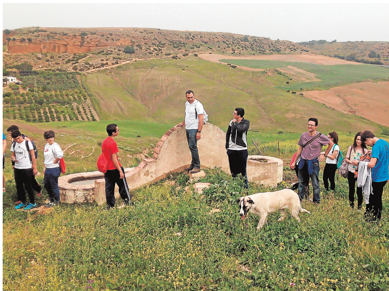
Una estampa de la ruta de los pilares, en la campiña de Carmona

El Pilar de la Pajarita está próxima a la ermita de San Mateo que fue construida en memoria de la reconquista de la ciudad de Carmona por el rey Fernando III El Santo en 1247. En la vía pecuaria denominada Cordel del Herrador, está el Pilar de Mealargo que fue construido en 1887 y restaurado en 1993. Junto a la Puerta de Córdoba hay otro pilar que posee caño y abrevadero. Está junto a una de las torres de la puerta romana, levantada entre finales del siglo I a.C. y principios del siglo I d.C. Su ubicación corresponde con la salida de la Vía Augusta dirección a Córdoba.