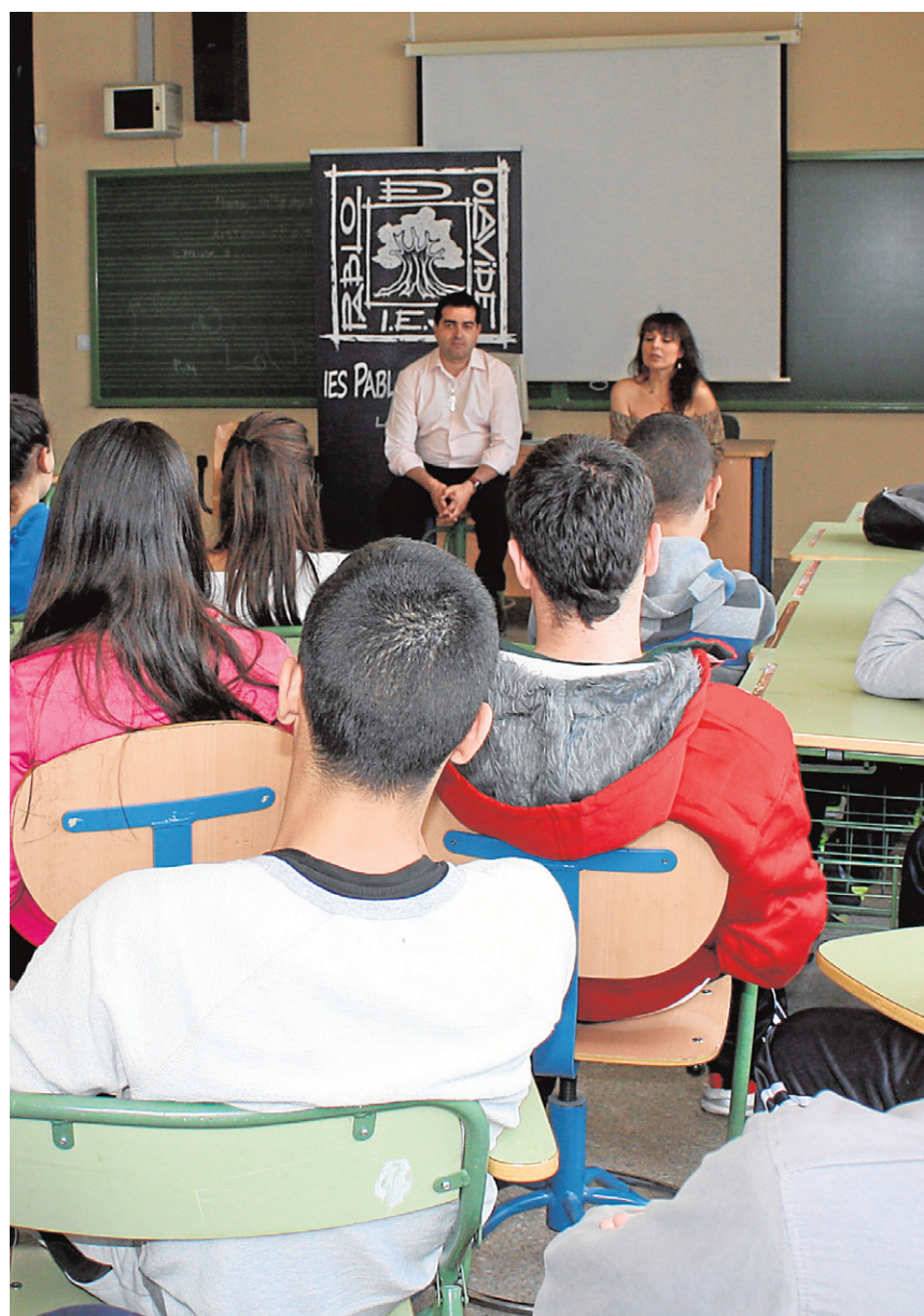
Alumnos del instituto, atentos en una charla sobre escritura